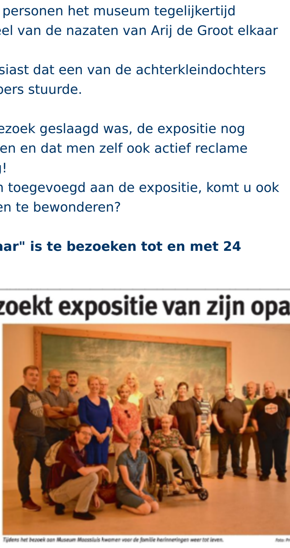
Tijdens het bezoek aan Museum Maassluis kwamen voor de familie herinneringen weer tot leven.